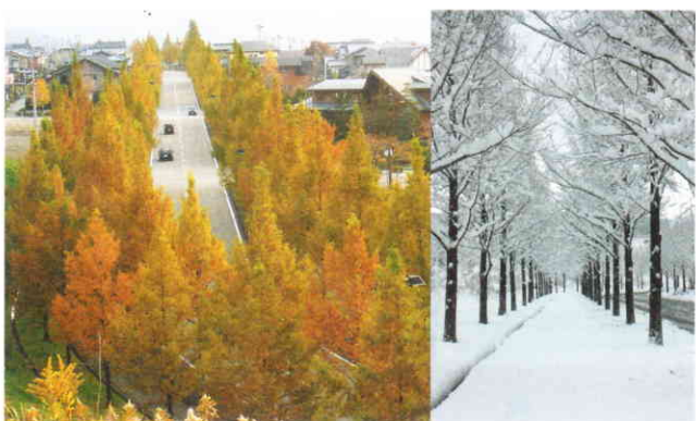
太陽が丘・並木通り

朝霧大橋から上流の右岸に、約200メートルにわたって桜並木が続きます。幹の太さが大人ひとかかえもある桜が40本ほどあり、大きく枝を広げています。4月上旬から中旬には桜の花が咲き、絶好のお花見ポイントになります。