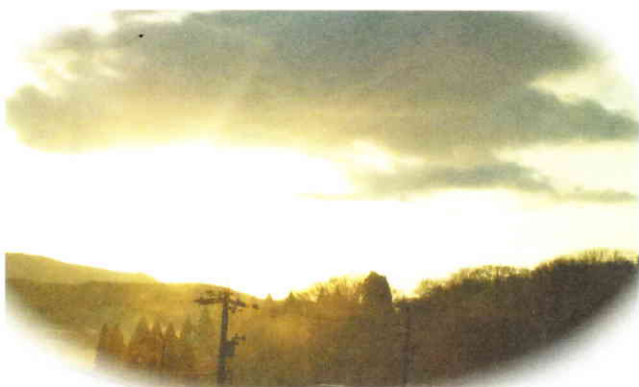
若松町第3児童公園

韓国ドラマ「冬のソナタ」に出てくる風景に似ていると、NHKでも取り上げられたところ。大きなメタセコイヤが1キロメートル以上も続く並木道は圧巻です。春の若葉、夏の青葉、秋の紅葉、冬の雪景色と、季節ごとに移り変わる眺めを楽しめます。